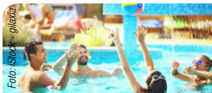
Tourismus & Freizeit

Wetterbereinigte Erfolgskennzahlen liefern Ihnen erhöhte Transparenz bei der Verfolgung Ihrer Unternehmensziele.