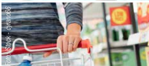
Produktion & Handel