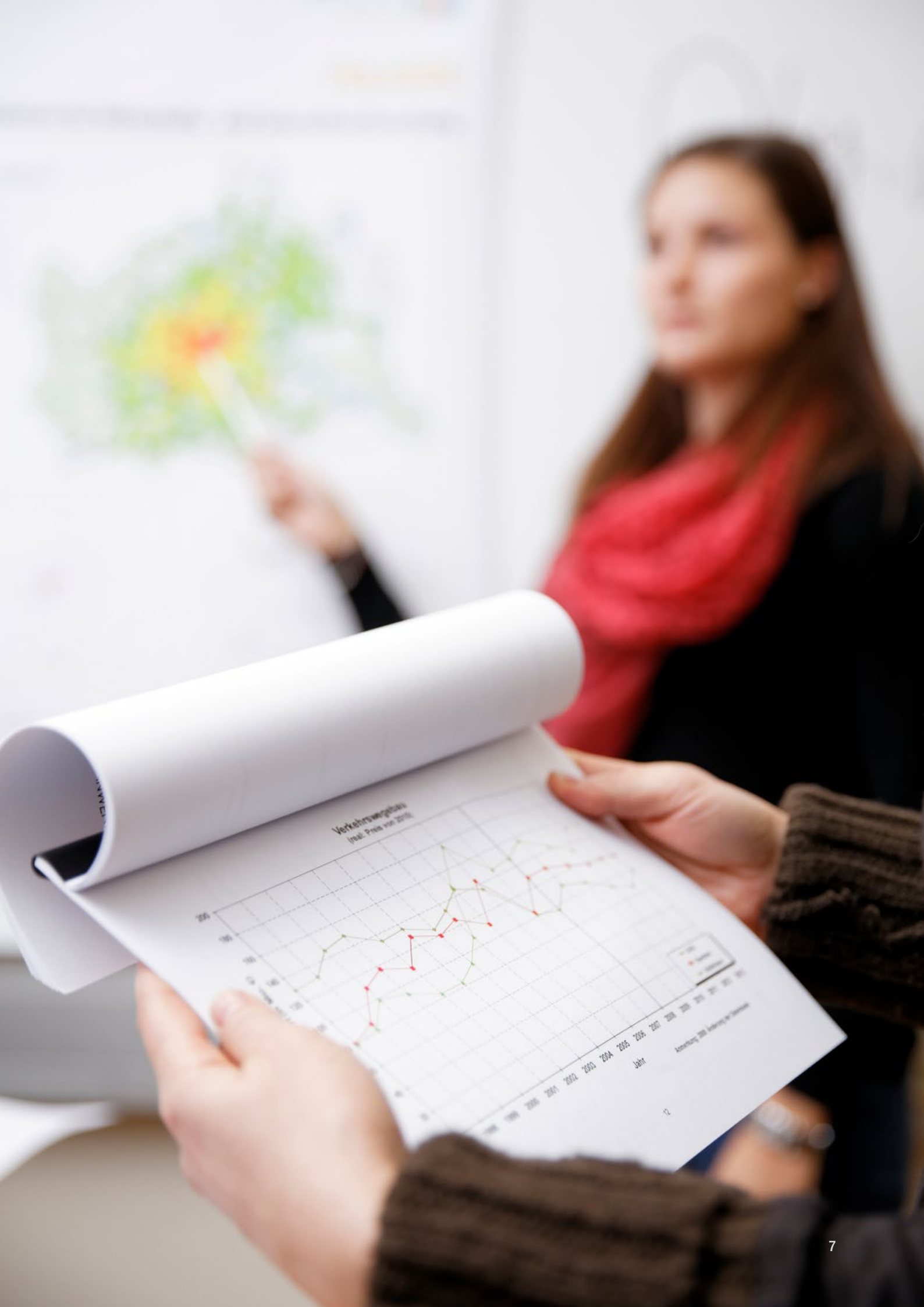
Verkehrswegbau (inkl. Preis von 2019)