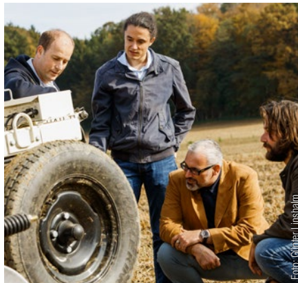
Datenanalyse und statistische Modellierung